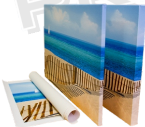
Foto, Poster & Canvas