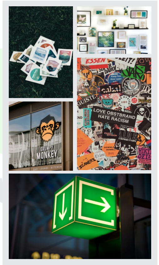
Stiker, NeonBox Dll.