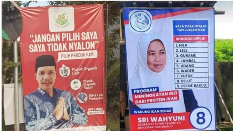
Banner Jualan / Banner Partai