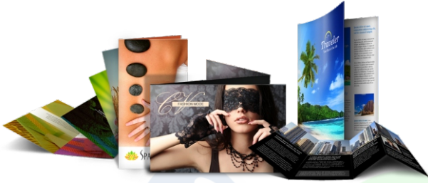
Brosur, Flayer, dll